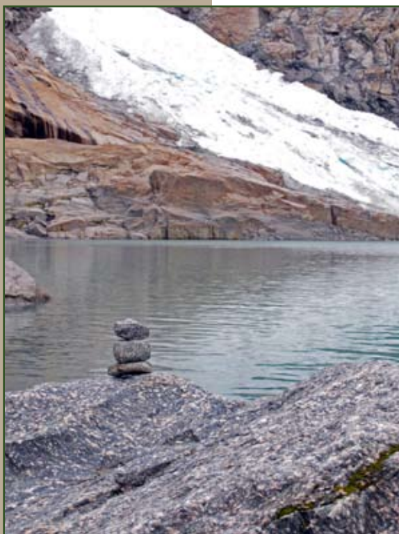
Detaljer fra Brikdals- breen.