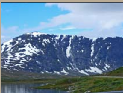
Strynefjellets højeste toppe, som tunnellerne går tværs igennem.

Grotli. Den blev skudt ned den 27. april 1940 af to engelske jagere, mens den var på bombetogt i Romsdalen og ligger altså stadig her ved vejen, hvor det nødlandede. Det tyske fly fik dog også ram på en af de engelske maskiner, som også nødlandede i nærheden, midt i søen Breidalsvatnet. Som en pudsighed kan nævnes, at begge nationers soldater søgte ly for natten i den samme fjeldhytte, hvor de blev enige om at lade våbnene tie. Tyskerne blev senere arresteret og ført i krigsfangenskab i England. Der skal i øvrigt laves en film om begivenheden i nær fremtid. Nå, alle de andre kørte forbi uden at se, hvad der lå i vejsiden. Hastværk er lastværk! Nu skal jeg ikke gøre mig bagklog, det sker såmænd lige så ofte, at vi må haste forbi noget, vi godt kunne ønske at se nærmere på, men da vi oftest halter bagud pga. af mange fotostops, sætter det sine grænser.